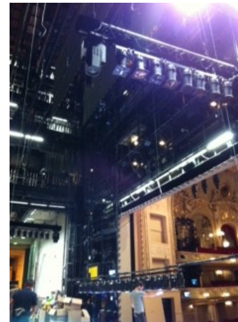
Wir durften während des Kulissenaufbaus auf die gigantische Bühne für das Stück „Ali Baba und die 40 Räuber“ gehen