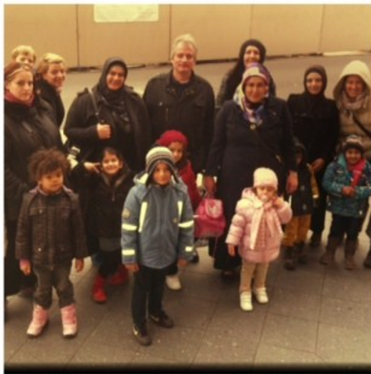
Eltern und Kinder aus den Kotti Kitas Adalbertstraße und Dresdener Straße