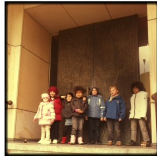
Unsere Kinder am Haupteingang der Komischen Oper