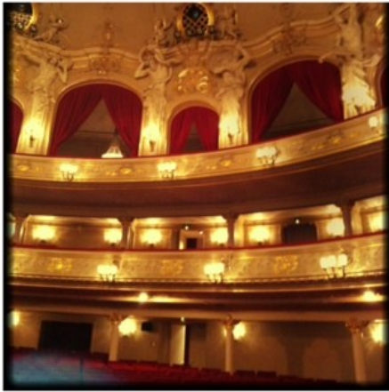
Eindrücke von den prächtigen Opernrängen