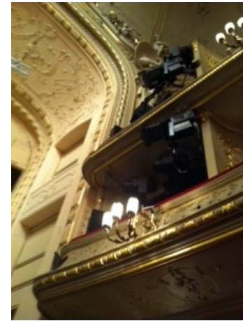
800 Scheinwerfer befinden sich verteilt im Opernsaal